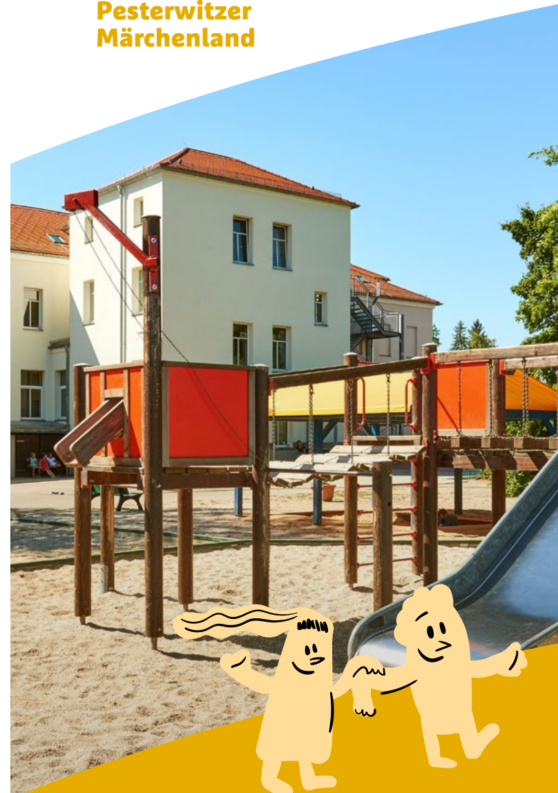
Hrsg.: Stadt Freital, Dresdner Straße 56, 01705 Freital

WILLKOMMEN IM SCHULHORT BETREUUNG, KONZEPT UND ALLTAG