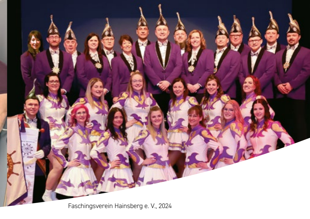
Faschingsverein Hainsberg e. V., 2024