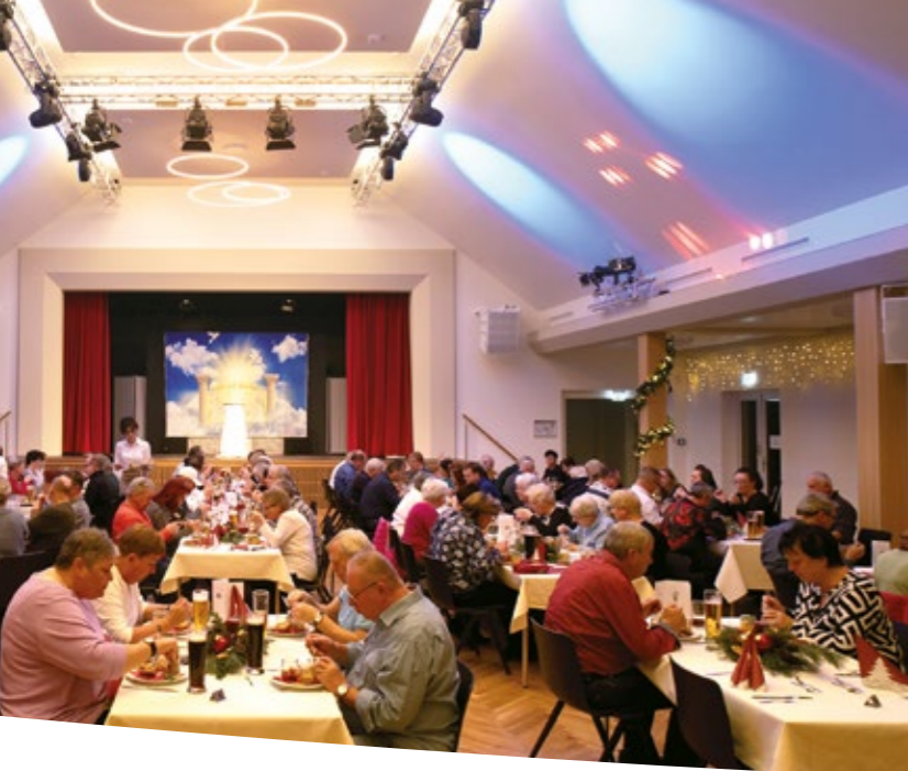
Feierlichkeit im Großen Saal, 2024