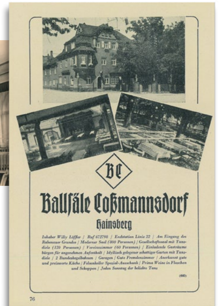
Annonce im Wanderführer Freital, 1936