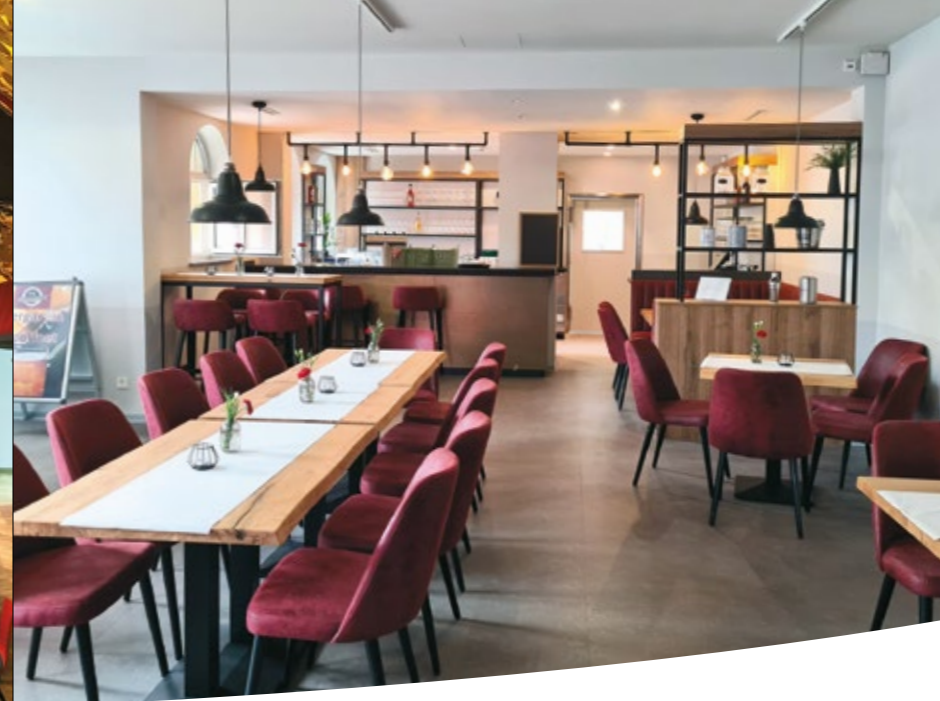
Gaststätte im Erdgeschoss mit Blick Richtung Barbereich, 2024