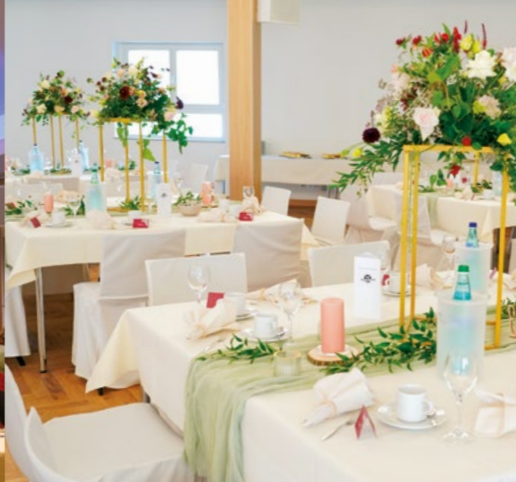
Hochzeitstafel im Großen Saal, 2024