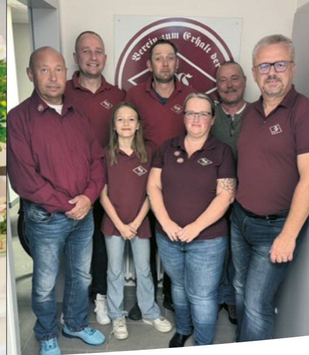
Verein zum Erhalt der Ballsäle Coßmannsdorf e. V., 2024