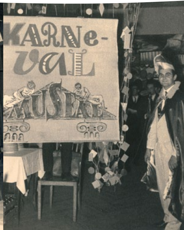
Faschingsveranstaltung Großer Saal, 70er-Jahre

2024: Nach vollständiger Modernisierung und Instandsetzung werden die Ballsäle Coßmannsdorf als Gemeinbedarfseinrichtung im April 2024 wiedereröffnet.