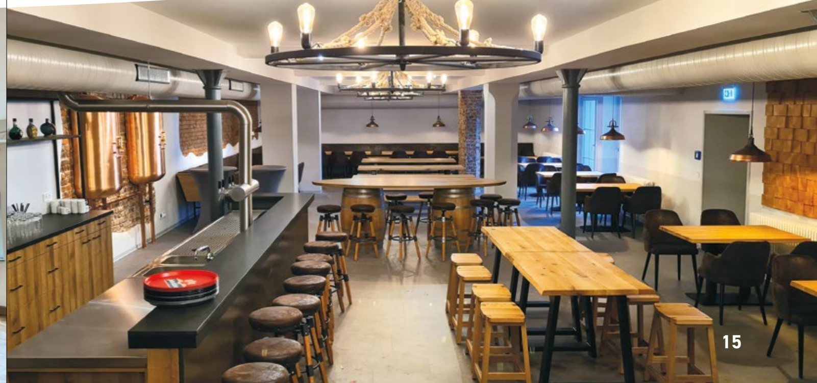
Brausaal im Erdgeschoss, 2024

Die zwei neu entstandene Mehrzweckbereiche im hinteren Bereich des Gebäudes sind für die Nutzung durch Vereine, Schulen, Organisationen und die Öffentlichkeit vorgesehen. Die Vereinsräumlichkeiten sind mit sanitären Anlagen, einer Küche mit Lager sowie Sozialräumen eingerichtet und Domizil zum Beispiel des Vereins zum Erhalt der Ballsäle Coßmannsdorf e. V. und des Faschingsvereins Hainsberg e. V.