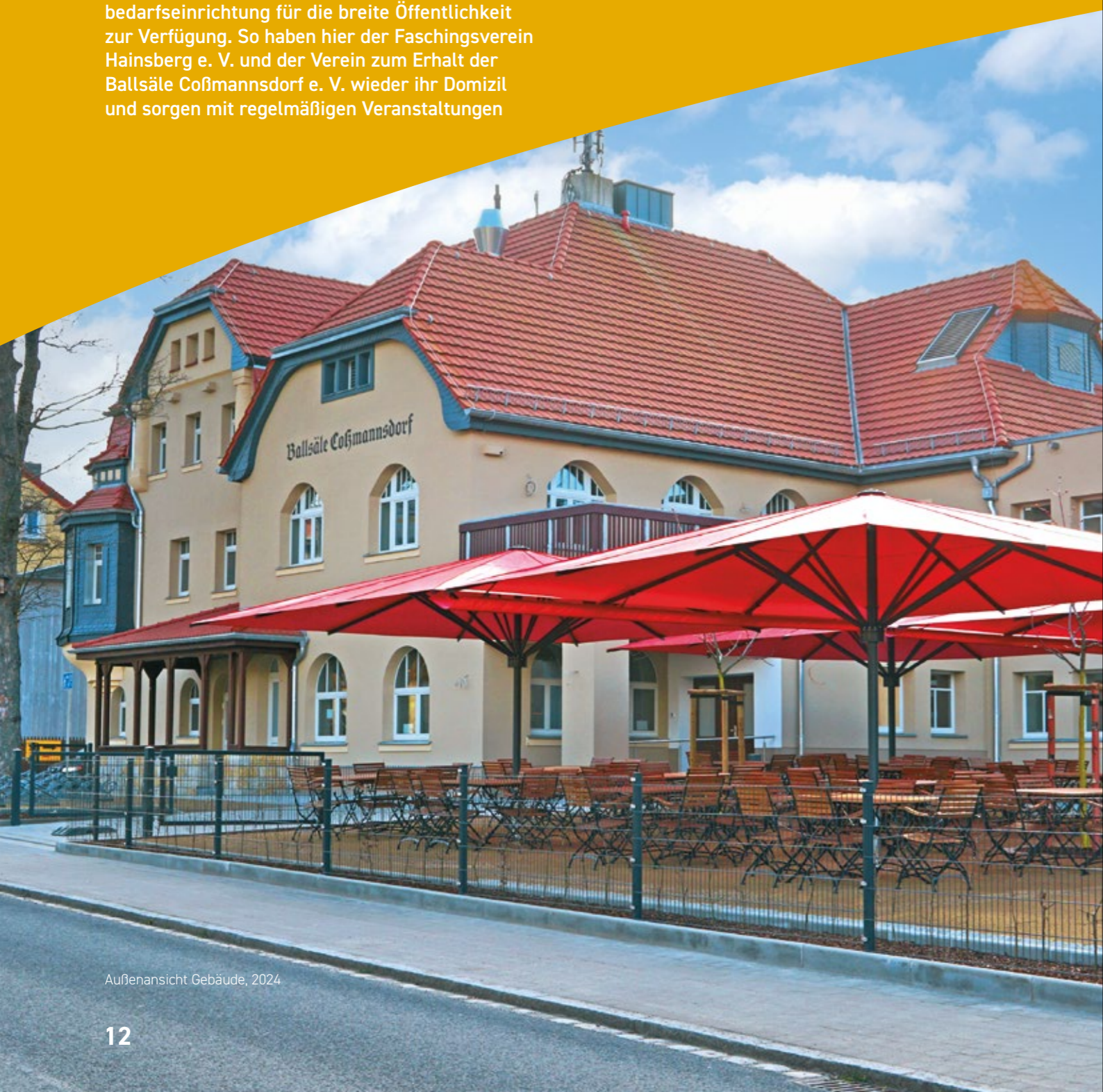
Außenansicht Gebäude, 2024

für Leben im Haus. Die städtische Gesellschaft TWF-Technische Werke Freital GmbH betreibt die Gaststätte, den Brausaal sowie den Biergarten im Außengelände und organisiert eine Vielzahl unterschiedlicher Events. Auch öffentliche und private Einmietungen sind möglich. Das Gebäude ist barrierefrei ausgebaut. Mit einem Mix aus traditionellem Charme und modernem Nutzen bieten die Ballsäle heute einen Raum für das Vereinsleben, Events, private Feiern und gesellschaftliche Begegnungen und tragen so zur kulturellen Vielfalt der Region bei.