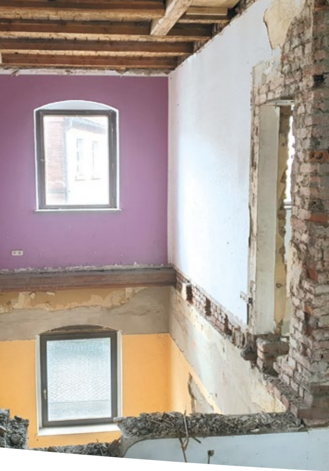
Abbrucharbeiten 1. OG, 2021