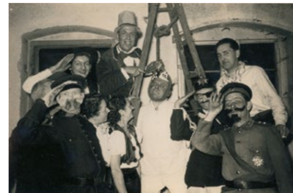
Erste Faschingsveranstaltung, 1951