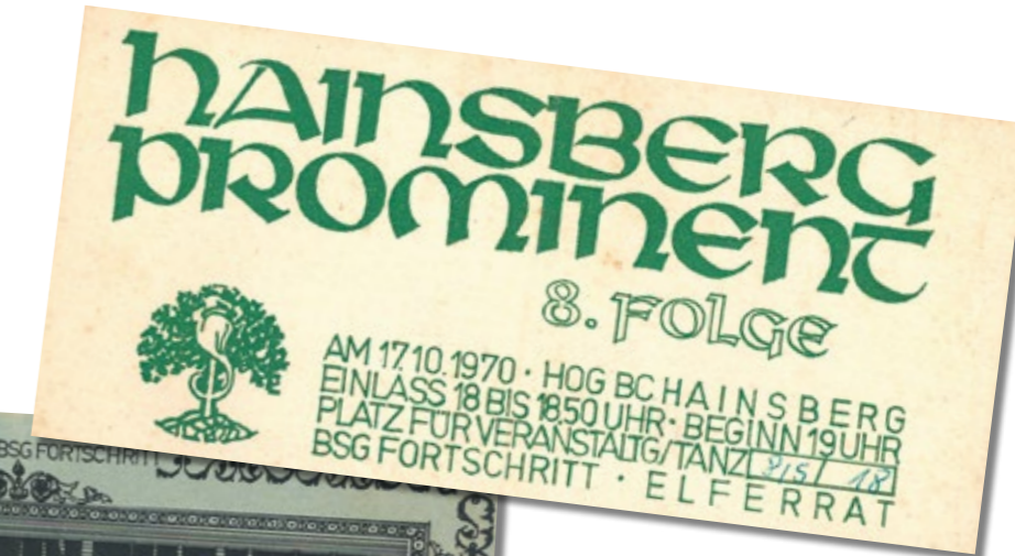
Eintrittskarten diverser Faschings- und Tanzveranstaltungen, 1968, 1970, 1973, 1977, 1985