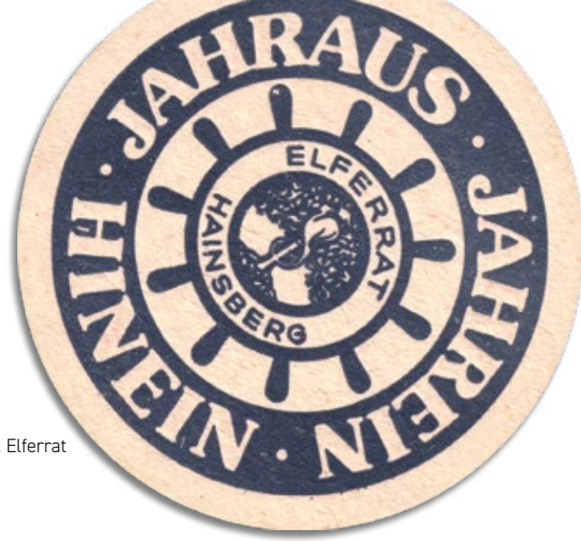
Bierdeckel Elferrat Hainsberg

1993: Wirtschaftliche Verwerfungen als Folge der deutschen Wiedervereinigung führen zu einer vorübergehenden Einstellung des Gastbetriebes. Ab Ende der neunziger Jahre wird der Betrieb durch einen neuen Pächter fortgeführt.