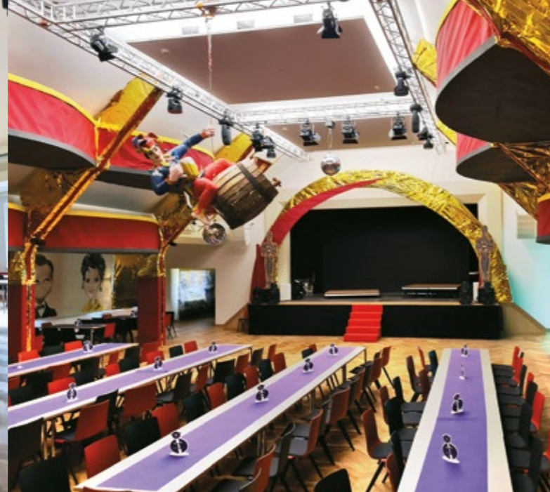
Großer Saal mit Blick in Richtung Bühne, 2024