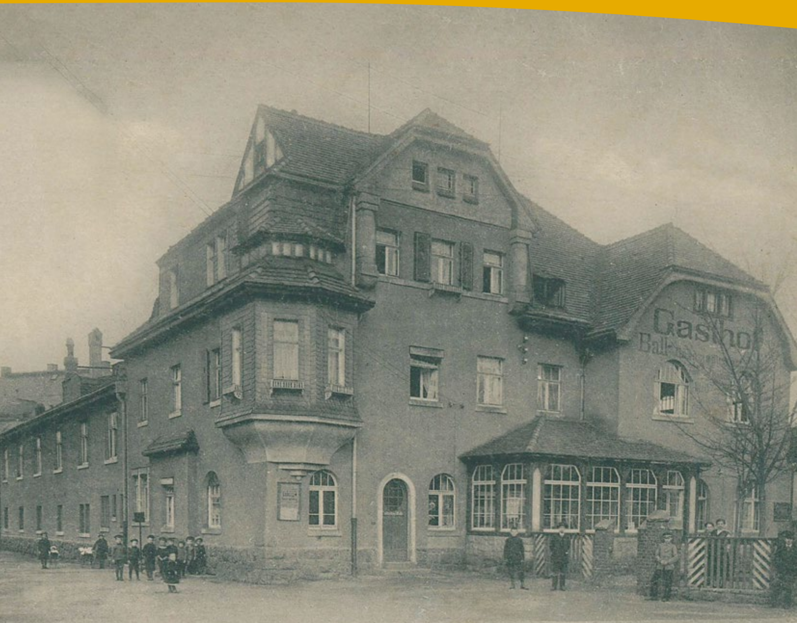
Außenansicht Gasthof, 1915