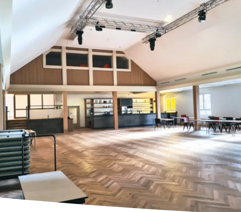
Großer Saal mit Blick in Richtung Barbereich und Technikraum, 2024