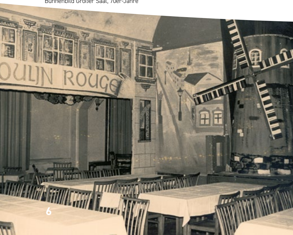
Bühnenbild Großer Saal, 70er-Jahre

2016: Das Objekt wird vom letzten Privateigentümer durch die städtische Wohnungsgesellschaft Freital mbH (WGF) erworben.