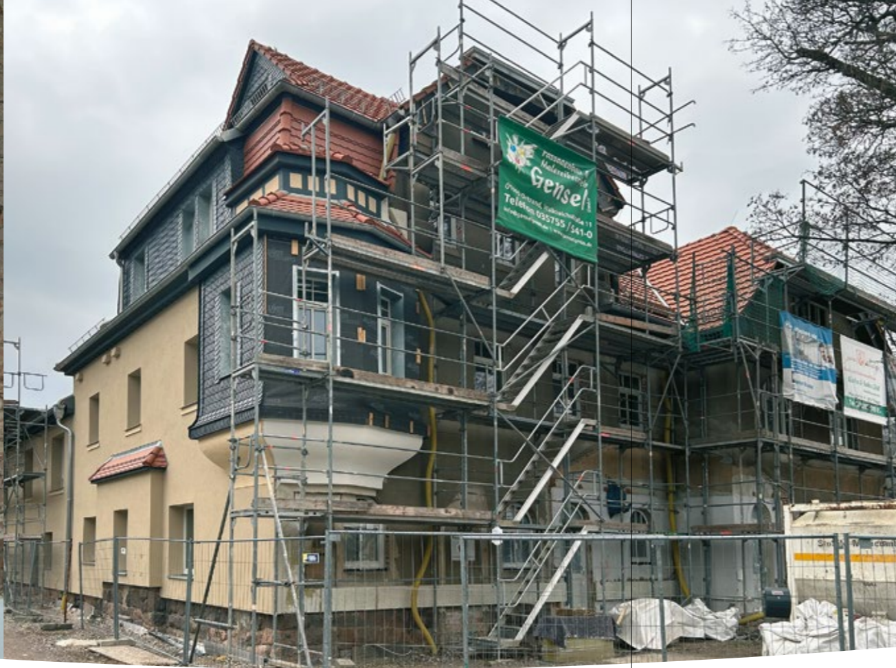
Fassadenarbeiten März 2023