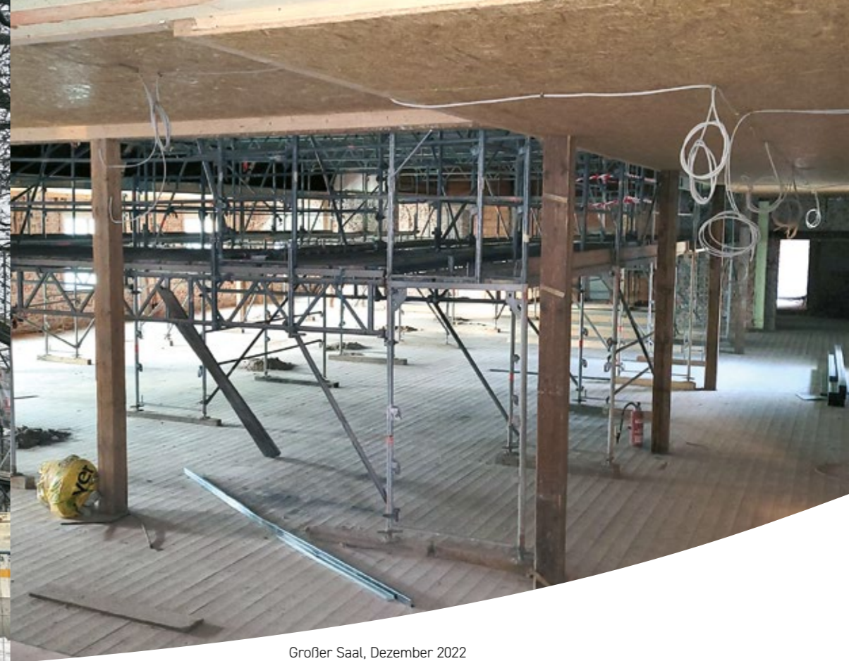
Großer Saal, Dezember 2022