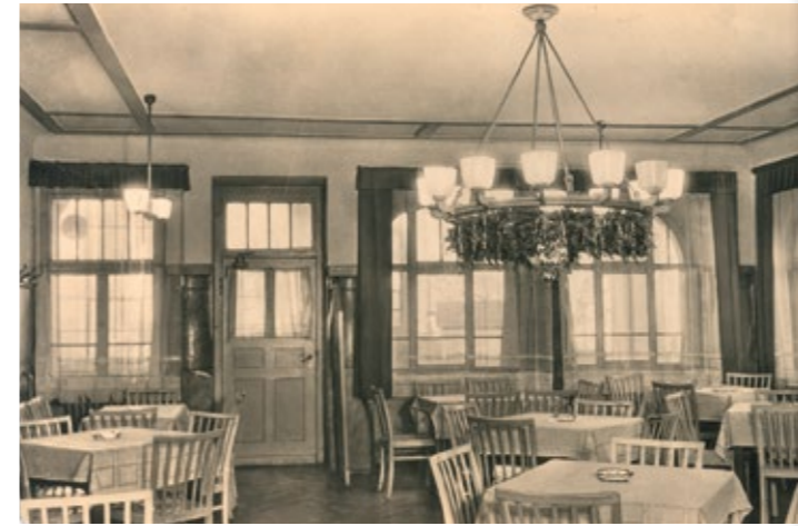
Kleiner Saal, um 1950