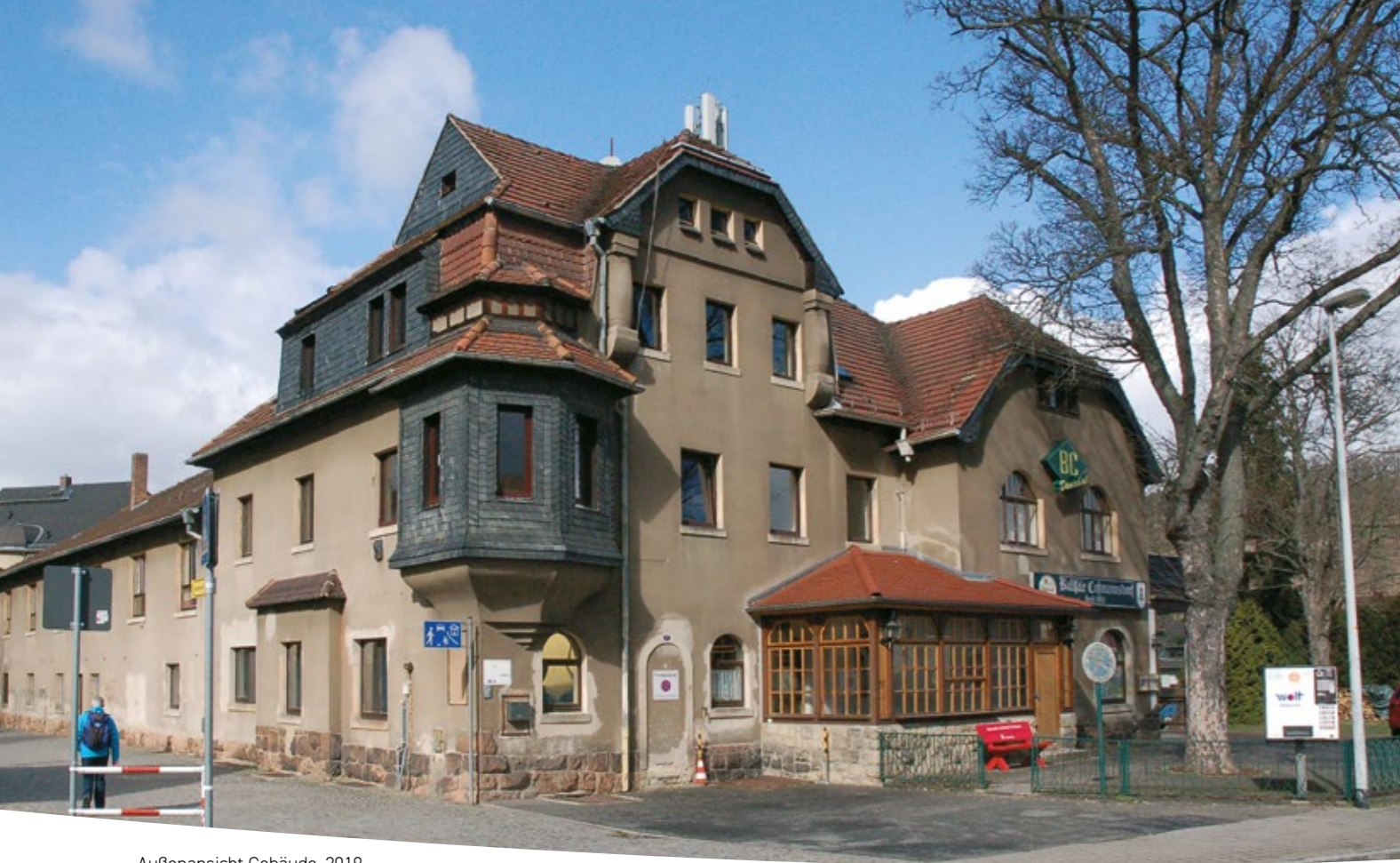
Außenansicht Gebäude, 2019