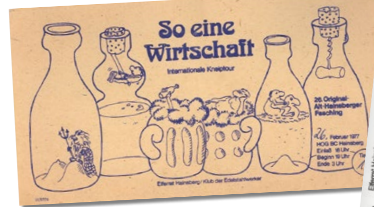
Faschingsverein Hainsberg e. V., 2020